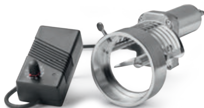
Gruppo motore coltello pasta corta a richiesta - Cutter assembly for short pasta by request Groupe moteur couteau pour pâte courte - Automatischer Abschneider auf Anfrage Grupo de corte electrónico para pasta corta sobre pedido